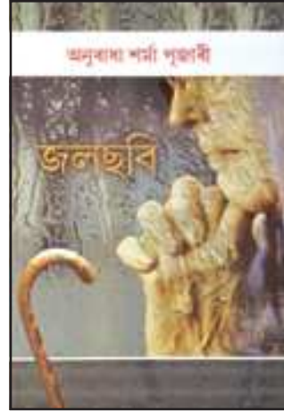
অনুৰূপা শৰ্মা পূজাৰীৰ জলছবি