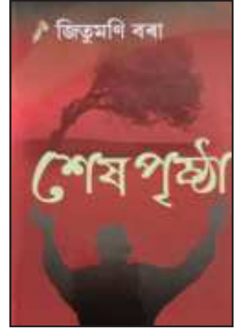
জিতুমণি বৰাৰ শেষ পৃষ্ঠা