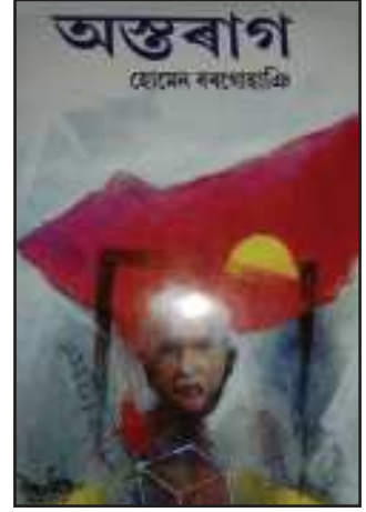
হোমেন বৰগোহাঞিৰ অস্তৰাগ