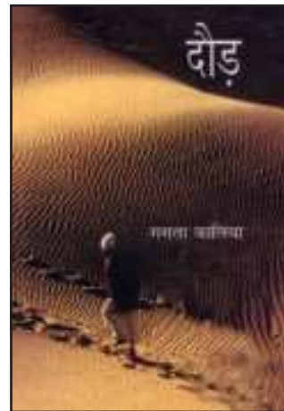
মমতা কালিয়াৰ দৌড়