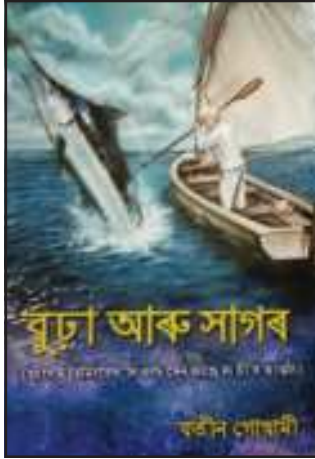
যতীন গোস্বামীৰ বুঢ়া আৰু সাগৰ (আৰ্ণেষ্ট হেমিংৱেৰ দ্য অ'ল্ড মেন এণ্ড দ্য ছীৰ ভাঙনি)