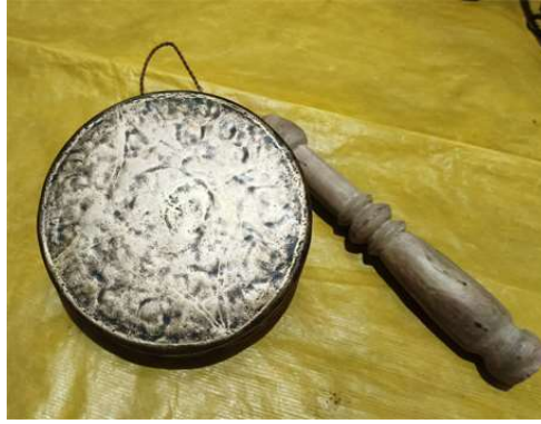
চিত্র : কাশী