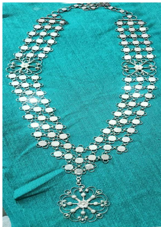
চিত্ৰ : চন্দ্ৰ হাড়