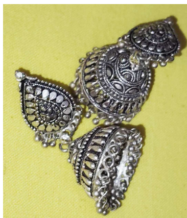
চিত্ৰ : বুমকা