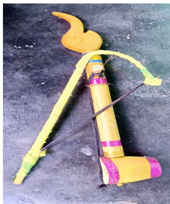
চিত্র : বেনা