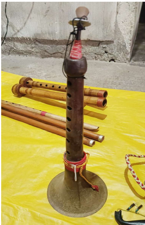
চিত্র : সানাই