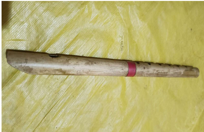
চিত্র : মুখবানী