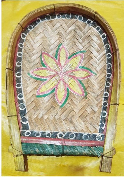
চিত্ৰ : কুলা

গোৱালিনী নৃত্যৰ এক গুৰুত্বপূৰ্ণ আহাৰ্য্য হৈছে ‘কুলা’। যাক গোৱালিনী নৃত্য পৰিৱেশন কৰোতে গোটেই নৃত্যটোতে এই ‘কুলা’ গাতত লৈ পৰিৱেশন কৰা হয়। এই কুলাত চাকি, ধূপ, ফুল, মিঠা প্ৰসাদ আদি সামগ্ৰী লোৱা হয়। প্ৰথমতে এই নৃত্যত বৰণ দিয়া হয়, সেই বৰণৰ সময়ত কৃষ্ণ দেৱতা আৰু মনসা দেৱীৰ স্মৰণ কৰি পূজা কৰি আৰু সেৱা লৈ নৃত্য আৰম্ভ কৰা হয়। কুলাৰ সহায়ত নৃত্যত ধানকটা, ধান উঠোৱা, ধানত বতাহ (ৰতান) দিয়া আদি কাৰ্য্য কৰা হয়।