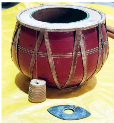
চিত্র : ঘুলটুং