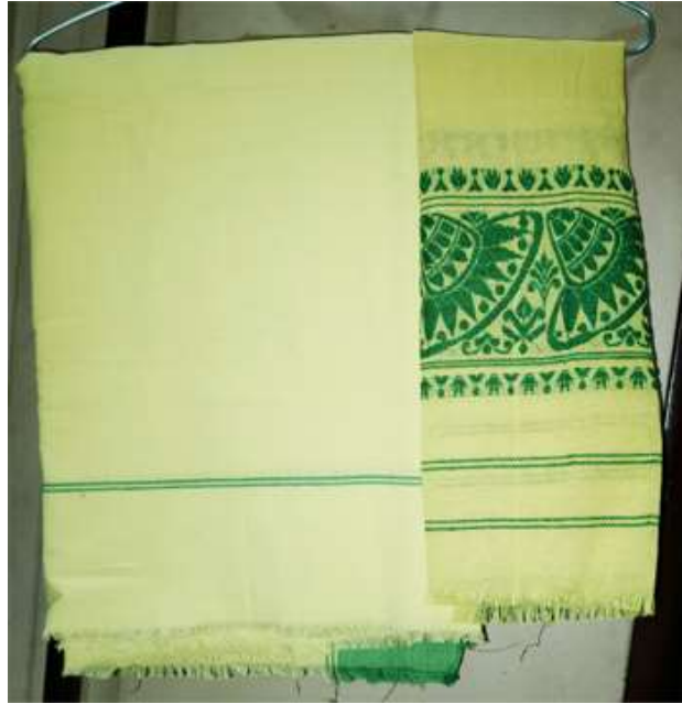
চিত্ৰ : পাটানী আৰু গামছা