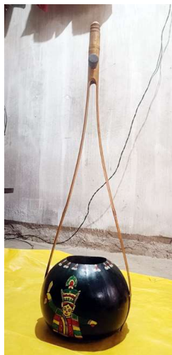
চিত্ৰ : বসমাদাৰী