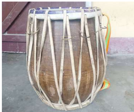
চিত্র : ঢোল