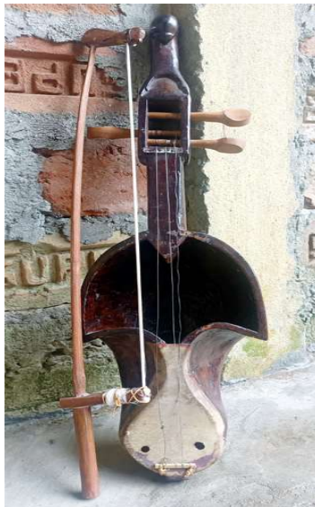
চিত্ৰ : সাৰিন্দা