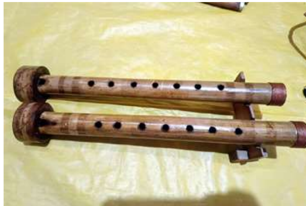
চিত্র : মুখাবাশী (আৰবাশী)