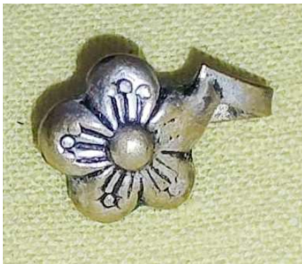
চিত্ৰ : নদ