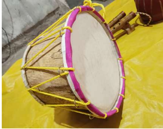
চিত্র : কৰ্কা