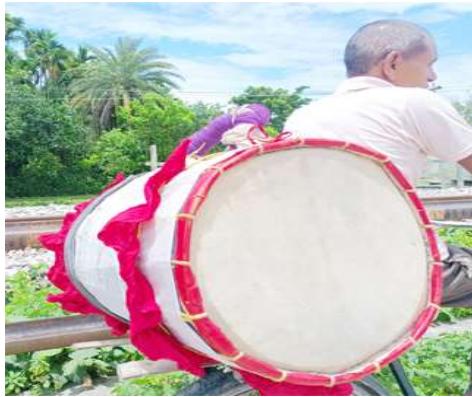
চিত্র : ঢাক