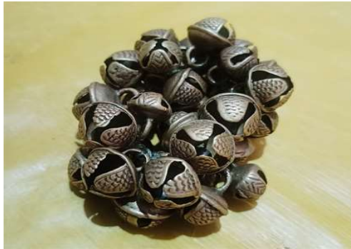
চিত্র : ঘুণ্ডা