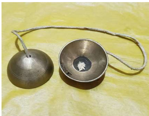
চিত্র : খুঞ্জুৰী