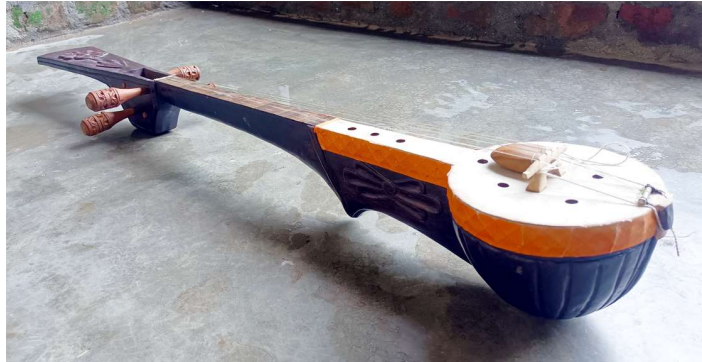
চিত্ৰ : দোতাৰা