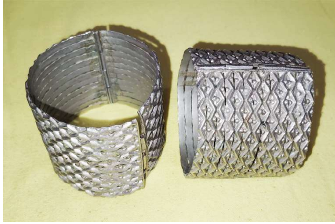
চিত্ৰ : মুঠাখাৰু

পৰম্পৰাগত মহিলা সকলে পৰিধান কৰা বস্ত্ৰৰ নাম :