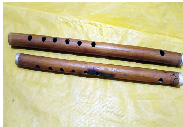
চিত্র : আৰবাশী