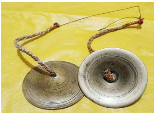
চিত্র : জুৰি