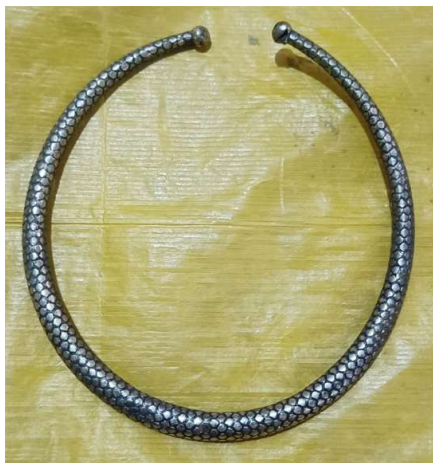
চিত্ৰ : হাসুলি